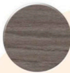
Olmo OM001 P.ITA Olmo OM001 P.ITA Olmo OM001 P.ITA

* a Diâmetro \varnothing 13\text{mm} Diâmetro \varnothing 19\text{mm} Diameter * b Espessura 0.6mm Espesor 1000 UNI. Thickness