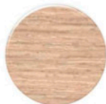
Carvalho CV095 Legno2 Roble CV095 Legno 2 Oak CV095 Legno 2