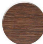
Sucupira SC001 PC Sucupira SC001 PC Sucupira SC001 PC

* a Diâmetro Diâmetro \varnothing 19\text{mm} Diameter * b Espessura 0.6mm Espesor 1000 UNI. Thickness