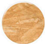
OSB OS001 LP OSB OS001 LP OSB OS001 LP

* a Diâmetro Diâmetro \varnothing 19\text{mm} Diameter * b Espessura 0.6mm Espesor 1000 UNI. Thickness