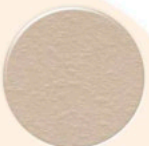
Cinza CZ073 LP Gris CZ073 LP Gris CZ073 LP