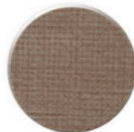
LINHO LN030 TEXTIL LINO LN030 TEXTIL LINO LN030 TEXTIL