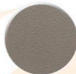
Cinza CZ005 SOFT Gris CZ005 SOFT Gris CZ005 SOFT