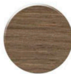
Nogueira NR077 Fusion Nugal NR077 Fusion Walnut NR077 Fusion

* a Diâmetro Diâmetro \varnothing 19\text{mm} Diameter * b Espessura 0.6mm Espesor 1000 UNI. Thickness