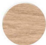
Carvalho CV257 Fusion Roble CV257 Fusion Oak CV257 Fusion

* a Diâmetro Diâmetro \varnothing 19\text{mm} Diameter * b Espessura 0.6mm Espesor 1000 UNI. Thickness