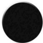
Preto Ng001 PC Negro NG001 PC Black NG001 PC

* a Diâmetro Diâmetro \varnothing 19\text{mm} Diameter * b Espessura 0.6mm Espesor 1000 UNI. Thickness