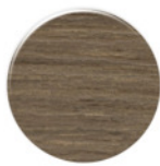
Nogueira NR077 Fusion Nogal NR077 Fusion Walnut NR077 Fusion