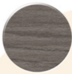
Olmo OM001 P.ITA Olmo OM001 P.ITA Olmo OM001 P.ITA