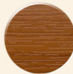
Cerejeira CJ010 PC Cerezo CJ010 PC Cherry CJ010 PC