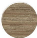
Carvalho CV080 Legno2 Roble CV080 Legno 2 Oak CV080 Legno 2