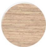
Carvalho CV095 Legno2 Roble CV095 Legno 2 Oak CV095 Legno 2