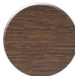
Sucupira SC001 PC Sucupira SC001 PC Sucupira SC001 PC