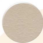
Cinza CZ073 LP Gris CZ073 LP Gris CZ073 LP