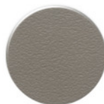
Cinza CZ005 SOFT Gris CZ005 SOFT Gris CZ005 SOFT