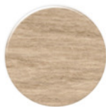
Carvalho CV257 Fusion Roble CV257 Fusion Oak CV257 Fusion