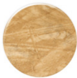
OSB OS001 LP OSB OS001 LP OSB OS001 LP

*a Diâmetro ø13mm Diâmetro ø19mm Diameter