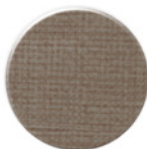
LINHO LN030 TEXTIL LINO LN030 TEXTIL LINO LN030 TEXTIL