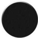
Preto Ng001 PC Negro NG001 PC Black NG001 PC